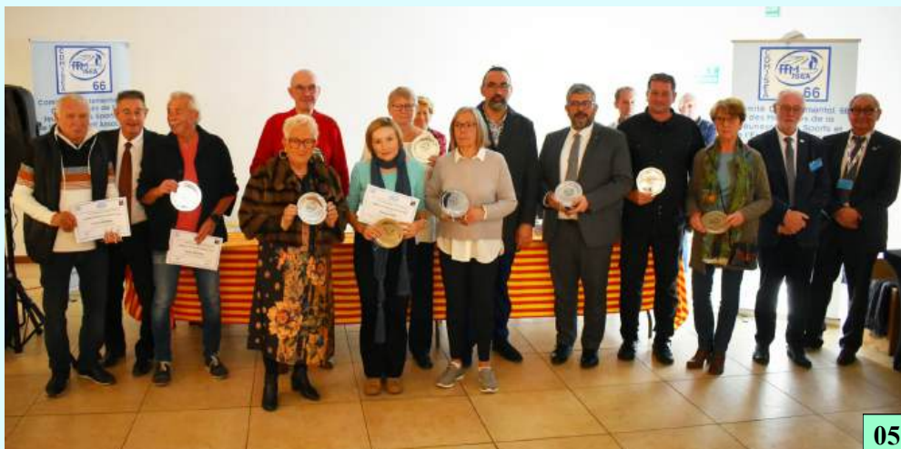
Remise des Trophées du Bénévolat de la FFMJSEA2024