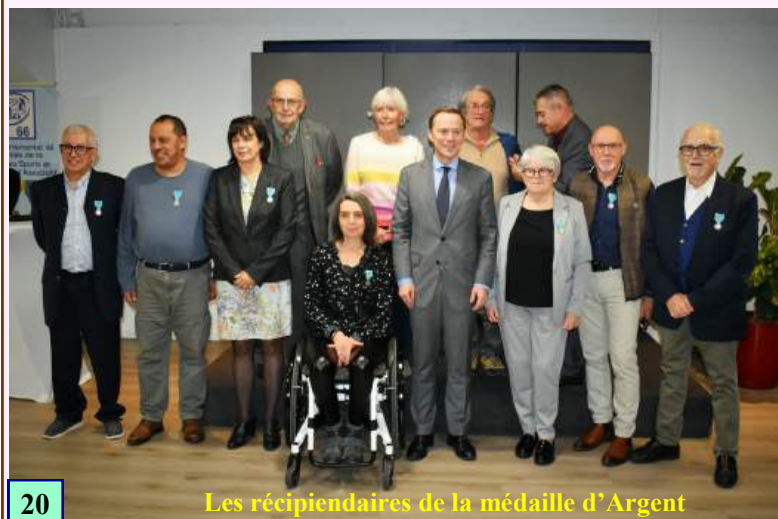
Les récipiendaires de la médaille d'Argent