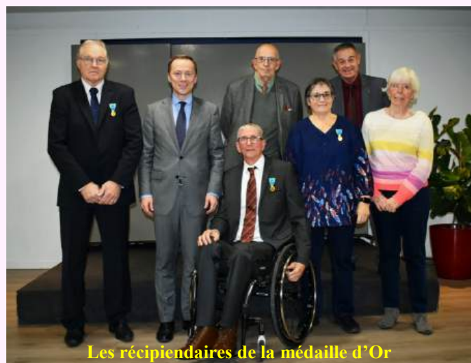
Les récipiendaires de la médaille d'Or