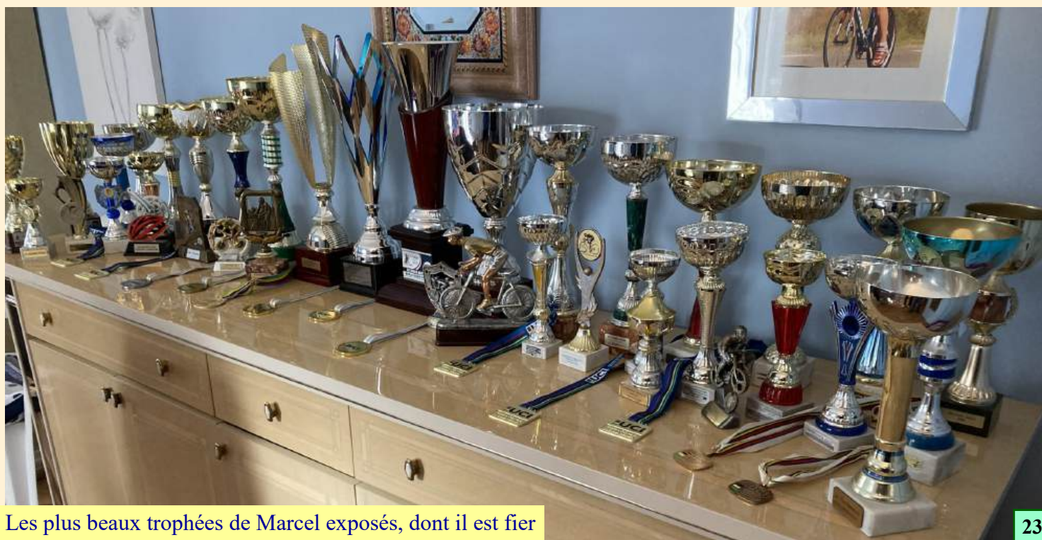
Les plus beaux trophées de Marcel exposés, dont il est fier